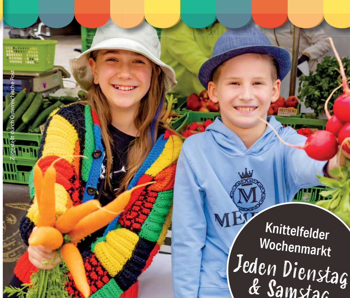
Zugestellt durch Österreichische Post

Knittelfelder Wochenmarkt Jeden Dienstag & Samstag 07 bis 12 Uhr